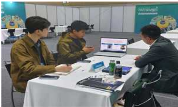
< 국내바이어 구매상담회 >