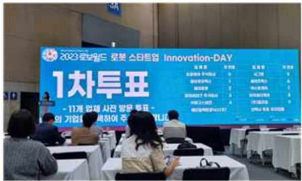
< 스타트업 Innovation Day - IR Speech >