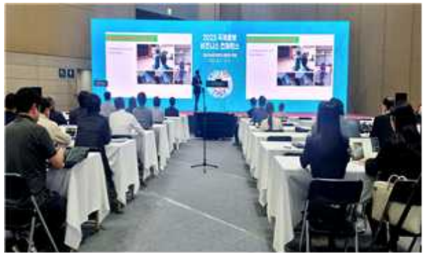
< 국제로봇비즈니스컨퍼런스 >