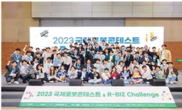
< 국제로봇콩테스트 & R-BIZ Challenge >