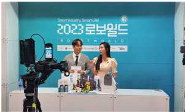
< 전시회 현장 라이브커머스 >