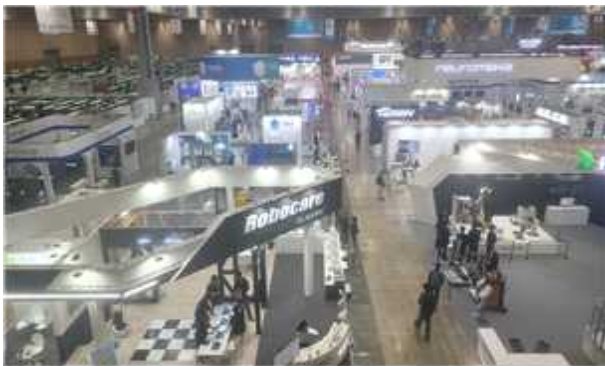
< 전시장 부스 전경 >