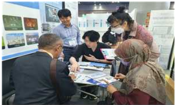
< 해외바이어 부스상담 >